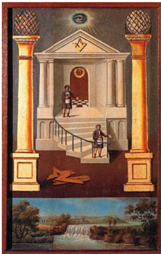
Cuadro de Logia del grado de Compañero

2. El número 5 es el del compañero y se encuentra homologado al pentágono. La edad del compañero es de 5 años, la batería del grado tiene 5 golpes; la marcha se hace con 5 pasos; la logia del compañero se ilumina con 5 luces.